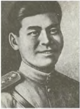
Баубек Бұлқышев атындағы жас журналистер клубының жаршысы

Газет - халықтың көзі, құлағы һәм тілі. А. Байтұрсынұв